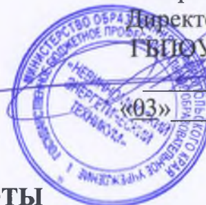
ГРАФИК РАБОТЫ спортивных секций ГБПОУ НЭТ на 2018-2019 учебный год