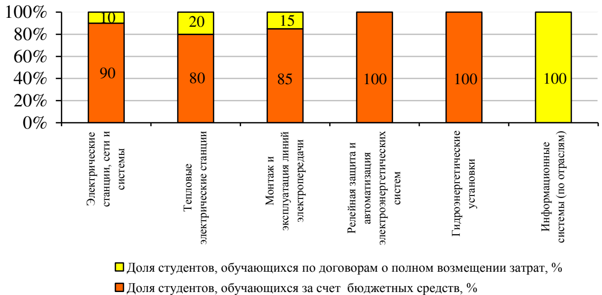
Рисунок 2 – Соотношение доли студентов, обучающихся по договорам об оказании платных образовательных услуг и за счет средств краевого бюджета.

На 31.12.2017 количество обучающихся за счет бюджетных средств по программам СПО составило 818 человек, а обучающихся по договорам об оказании платных образовательных услуг 164. Соотношение количества студентов в зависимости от источников финансирования обучения по совокупности различных специальностей представлено на нижеприведенной схеме.