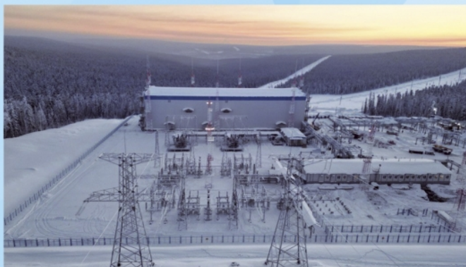
Подстанция ПС 220 кВ Ковыкта, Иркутский филиал ООО «Газпром энерго»

В ООО «Газпром энерго» 12 филиалов, которые работают в регионах деятельности основных предприятий ПАО «Газпром». На сегодняшний день самым молодым, с даты образования – 7 октября 2022 года, является Иркутский филиал ООО «Газпром энерго» .