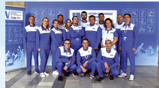
Работники Иркутского и Центрального филиалов, участники IV Летней Спартакиады ООО «Газпром энерго», 2023 г.

Мы уделяем большое внимание социальной ответственности, охране окружающей среды, а также вносим серьезный вклад в продвижение ценностей спорта и здорового образа жизни в регионах присутствия.